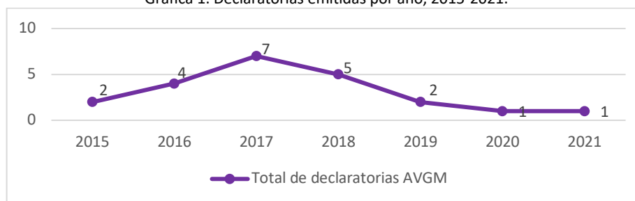
Gráfica 1. Declaratorias emitidas por año, 2015-2021.

Fuente: CNDH, con base en información publicada por CONAVIM.