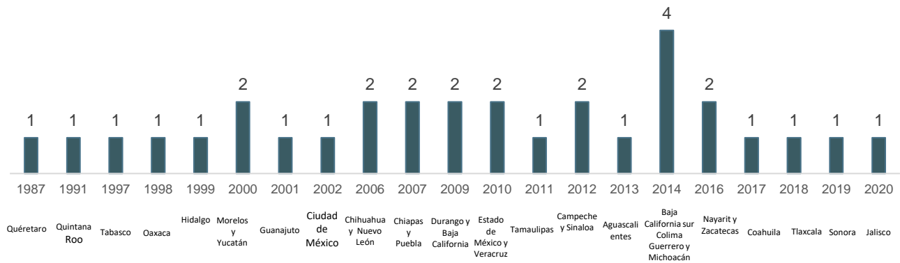
Gráfica 2. Regulación de la de la violación entre cónyuges como delito por año de publicación