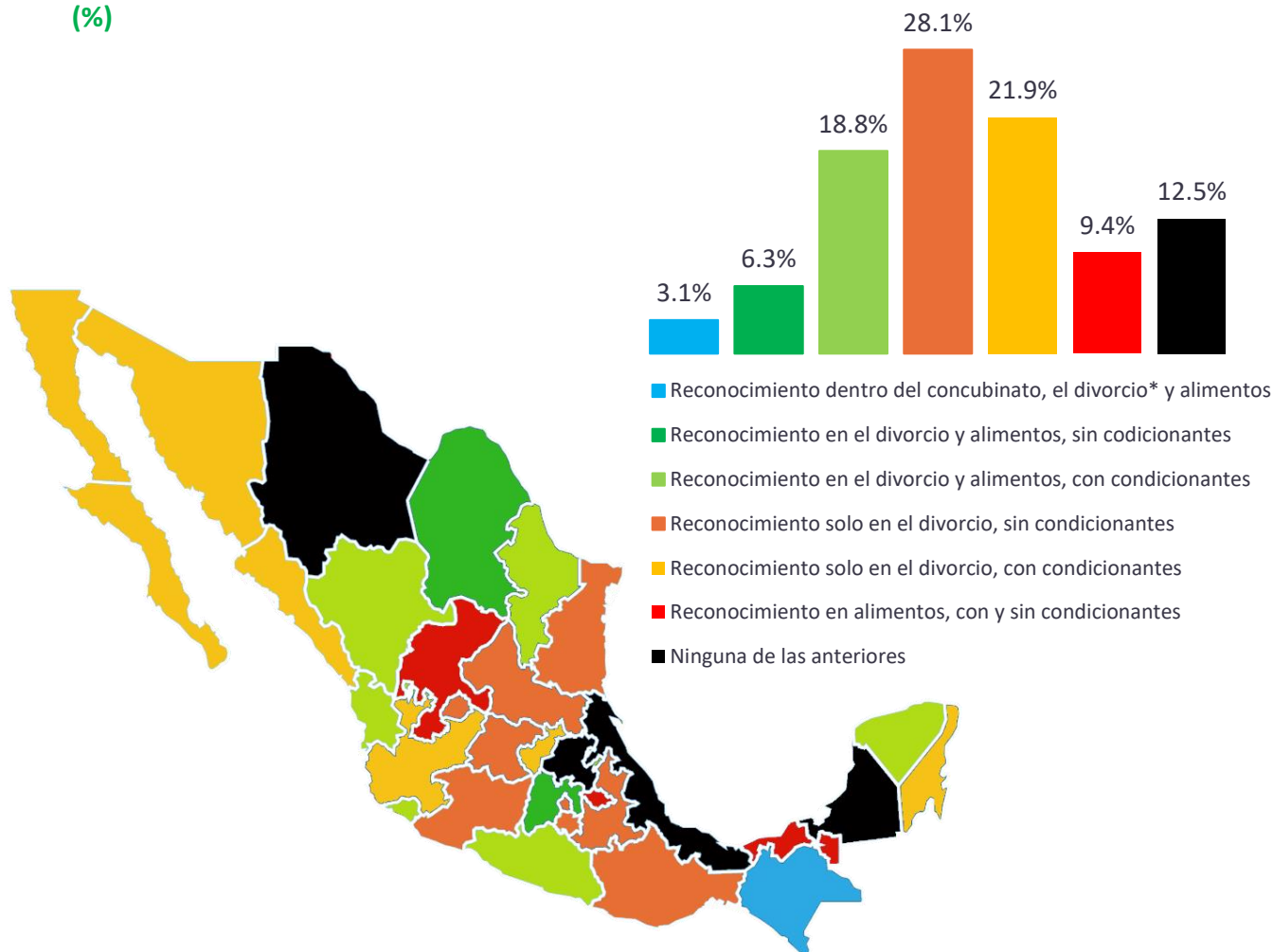
Figura 2. Regulación del reconocimiento del trabajo del hogar en las entidades federativas (%)