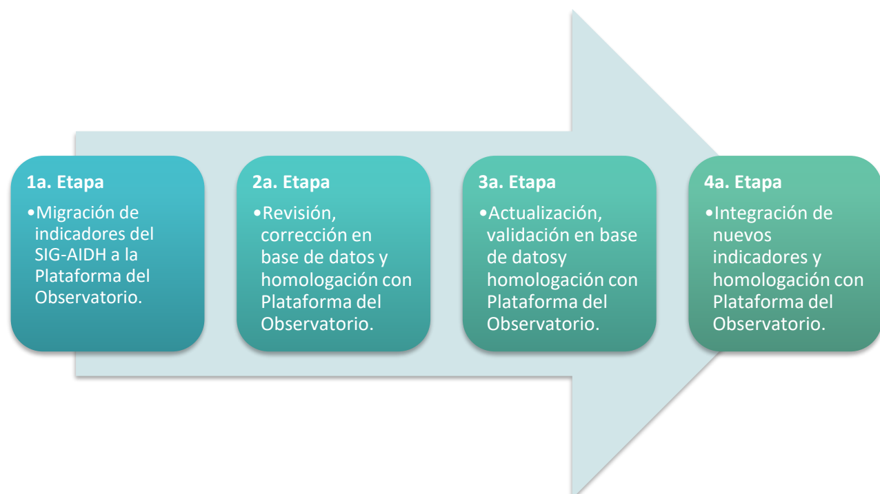
Esquema 2. Etapas generales y sus fases para el fortalecimiento del AIDH

El fortalecimiento del AIDH consta de 4 etapas generales, las cuales para cada una se contempla 6 meses de trabajo coordinado entre las áreas correspondientes del CAIG y del PAMIMH: