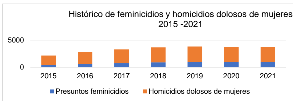
Tabla 1. Histórico de feminicidios y homicidios dolosos de mujeres 2015-2021. Fuente, elaboración propia con datos del Secretariado Ejecutivo del Sistema Nacional de Seguridad Pública.

También, con base en información de Data Cívica 3 refiere que en 2015 ocurrieron 1,031 feminicidios y 3,765 homicidios dolosos de mujeres; en 2016 ocurrieron 1,467 feminicidios y 4,517 homicidios dolosos de mujeres; en 2017 ocurrieron 1,528 presuntos feminicidios y 5,426 homicidios dolosos de mujeres; en 2018 ocurrieron 1,493 presuntos feminicidios; en 2019 ocurrieron 1,412 presuntos feminicidios y 5,918 homicidios dolosos y en 2020 1,398 feminicidios y 5,886 homicidios dolosos.