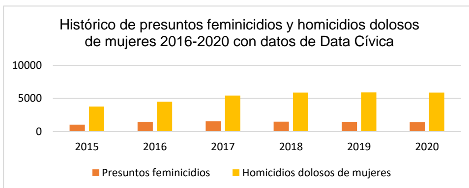
Tabla 3. Comparativo de homicidios dolosos y feminicidios en enero de 2022.

También, con base en información de Data Cívica 3 refiere que en 2015 ocurrieron 1,031 feminicidios y 3,765 homicidios dolosos de mujeres; en 2016 ocurrieron 1,467 feminicidios y 4,517 homicidios dolosos de mujeres; en 2017 ocurrieron 1,528 presuntos feminicidios y 5,426 homicidios dolosos de mujeres; en 2018 ocurrieron 1,493 presuntos feminicidios; en 2019 ocurrieron 1,412 presuntos feminicidios y 5,918 homicidios dolosos y en 2020 1,398 feminicidios y 5,886 homicidios dolosos.